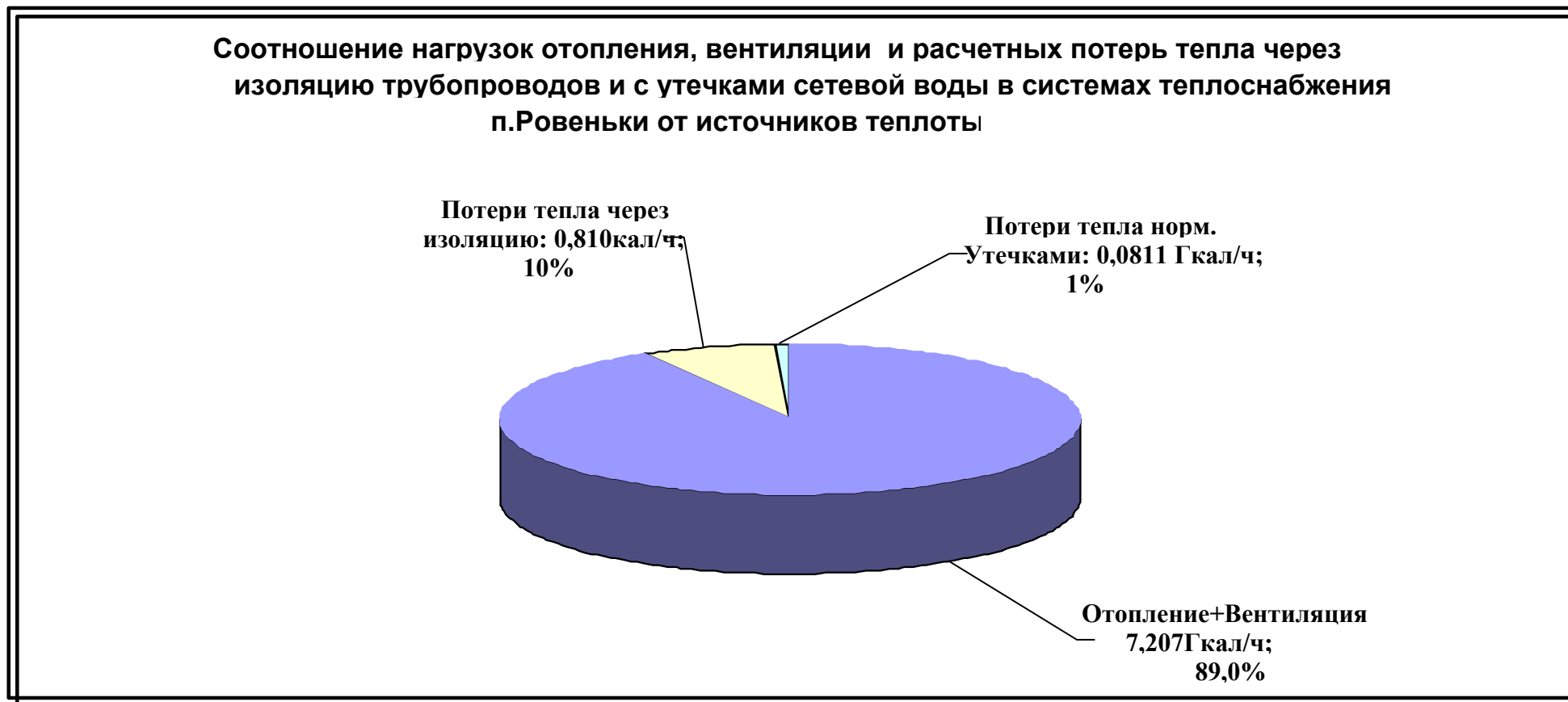
Рис.1.3. Соотношение нагрузок отопления, вентиляции и расчетных потерь в системах теплоснабжения п.Ровеньки от всех источников теплоты

Соотношение нагрузок отопления, вентиляции и расчетных потерь тепла в системах теплоснабжения п.Ровеньки от всех источников теплоты представлено на рис.1.3.