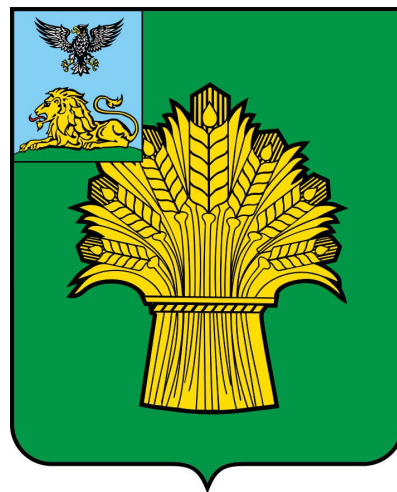
СХЕМА п. Ровеньки Ровеньского района (Актуализация на 2022 год)